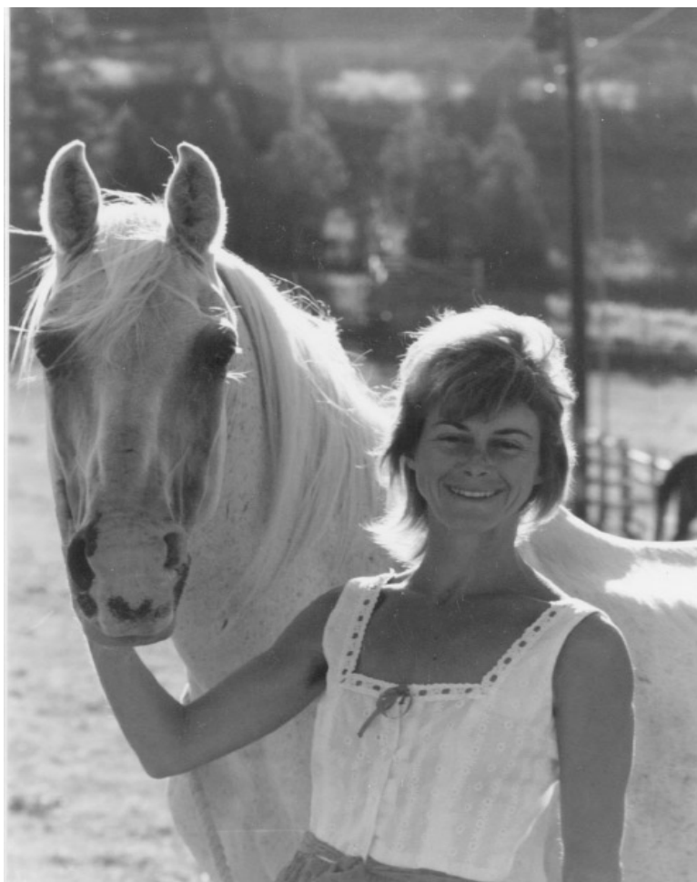
Bravo och jag sommaren 1987. Bravo har betäckt 13 ston den säsongen.

Naturligtvis var BRAVO inte till salu men jag bad Bud att låta mig veta om han någon gång blev det.