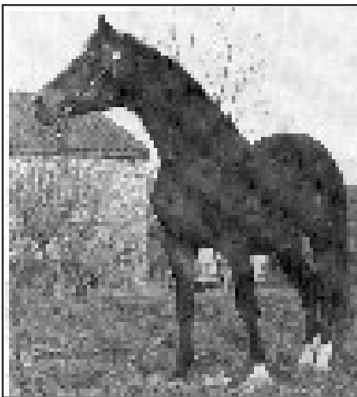
KOHEILAN II, e. Koheilan I u. 632 Shagya VII, född 1961 Uppfödare: Tschechoslovakisches Staatsgestut

Hannover och Bavaria, såväl som på trakehnerstuteriet, håller arvet från Radautz vid liv.